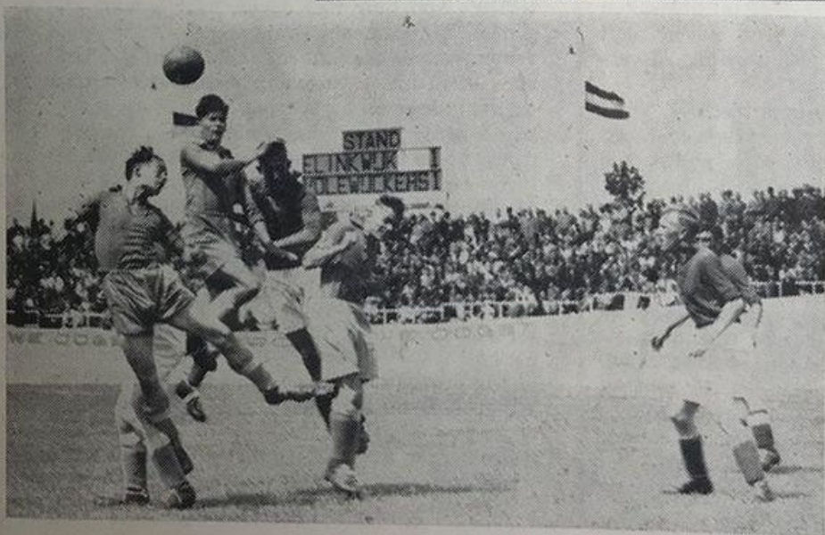
1941 Kampioen 2e klasse