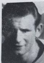
J. DE VRIES