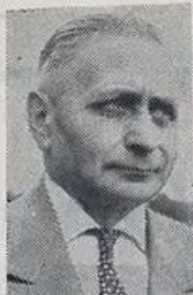
PH. K. CORSTENS