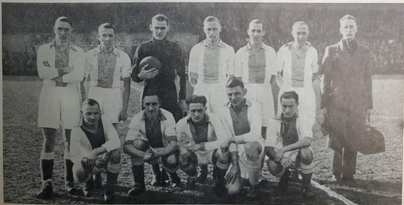
Kampioen 1e klasse 1943

En het is op die gedenkwaardige, bijzondere vergadering in de Nieuwendammerham, dat onze leden beslisten, dat ook de Volewijckers de nieuwe weg moesten inslaan, dat was 1954. We waren dus ook toege-