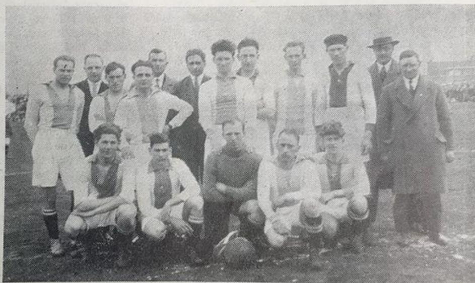
1929 Kampioen 3e klasse