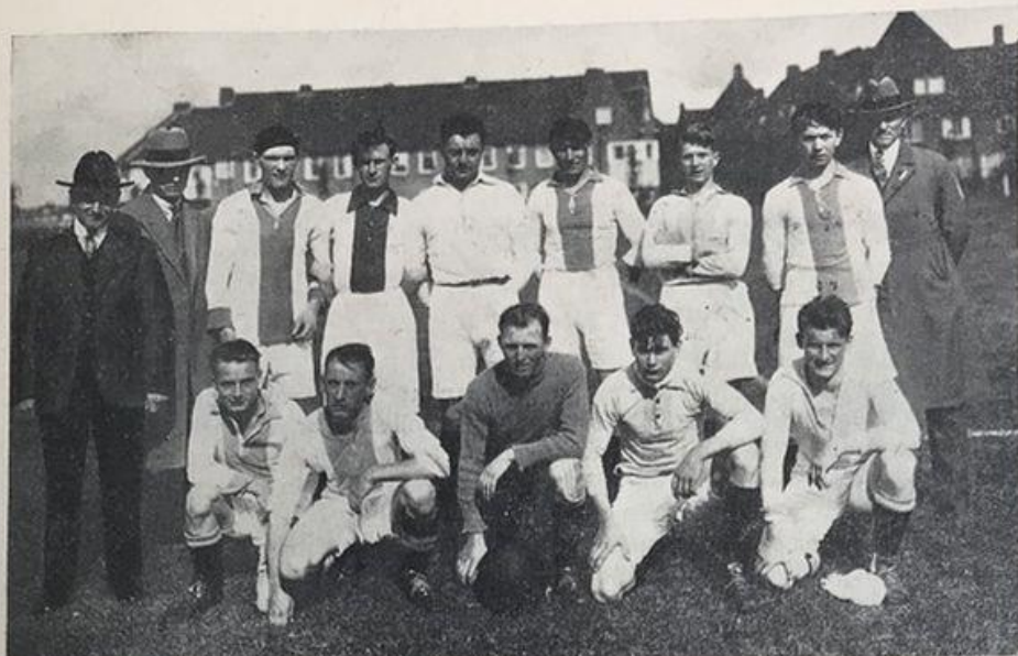
1e Elftal 1926