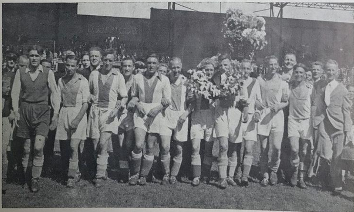
Kampioens-elftal 1944 — Kampioen van Nederland