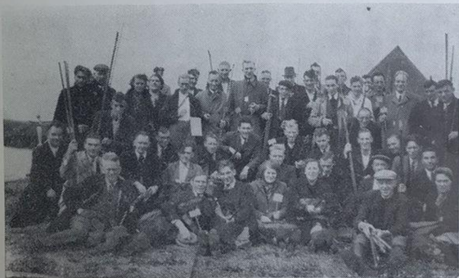
Jaarlijkse viswedstrijd in het N.-H. Kanaal uit vroeger jaren.