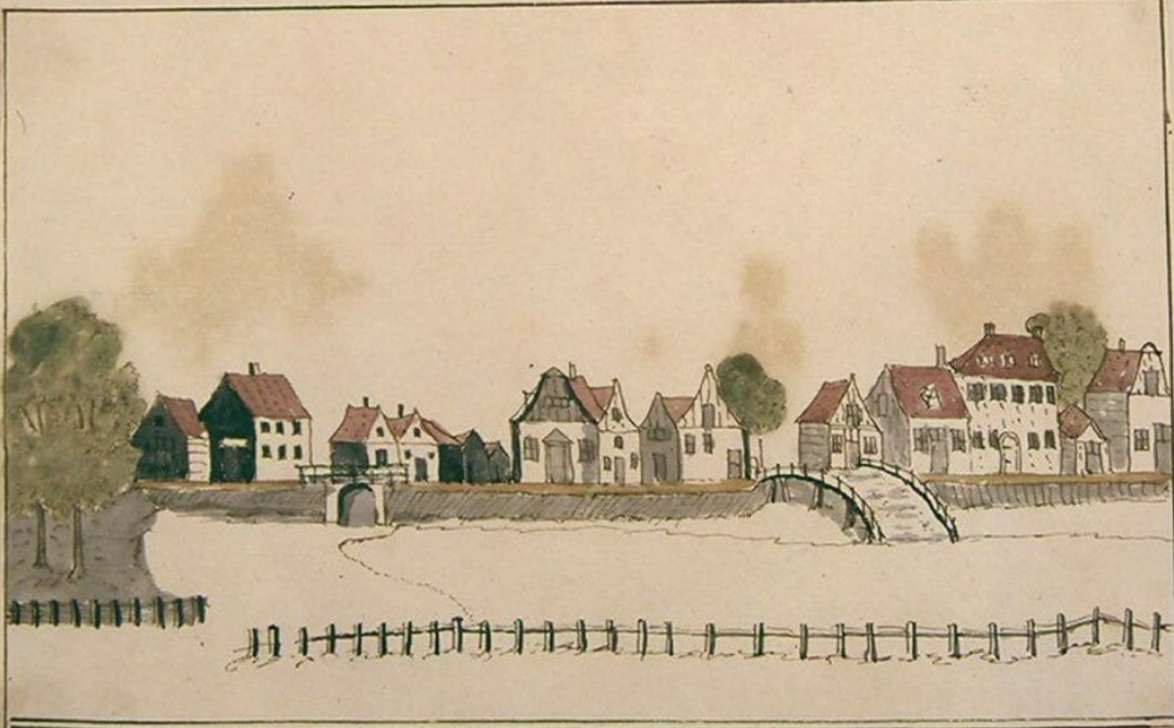
Buikhloot by den Aanklag Griepen Dyke