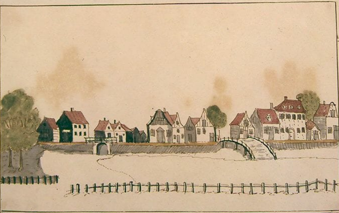
Bouyck floot by den Aau Hag Bouyck dyck